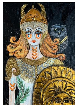
Miroslava Kos, "Atena", kombinirana tehnika na platnu, 70x50 cm