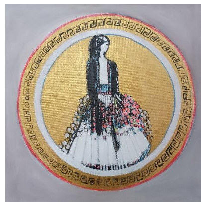
Rada Marković, "Perzefona", akril na platnu, 50x50 cm