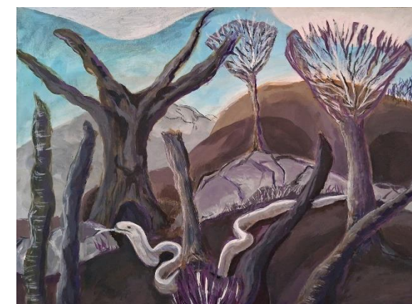
Dubravka Lukić, "Perun izgoni Velesa", akril na kartonu, 25x35 cm