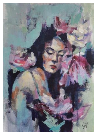
Nikolina Car Jergović, "Morana", akril i ugljen na papiru, 52x37 cm