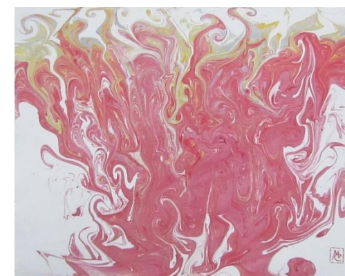
Marija Čingel, "Gorući grm", suminagashi (tuš na papiru), 50x60 cm