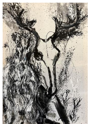
Jelena Martinović, "Veles", tuš i akrilik na svili, 100x70 cm