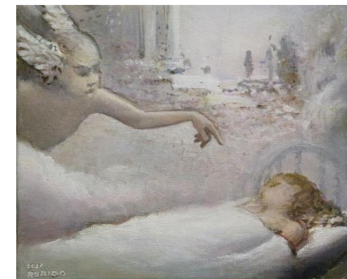
Dalibor Rubido, "Morfej", ulje na platnu, 24x30 cm