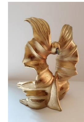
Sanja Fališevac, "Fenix - iznad sutona", terakota i mramor, 8x30x16 cm