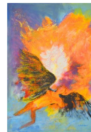
Antonija Cesarec, "Ikarov pad", akril na platnu, 100x70 cm