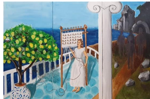
Tamara Perušić, "Penelopa", akril na platnu, triptih, 3x 60x30 cm