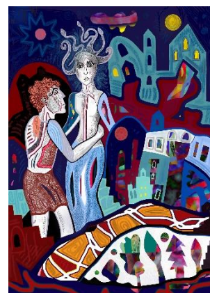
Krešimira Gojanović, "Posejdon i Meduza", digitalna ilustracija, 42x29,7 cm