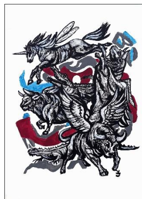
Vanda Jurković, "Hibridi", akrilik na papiru, 70x50 cm