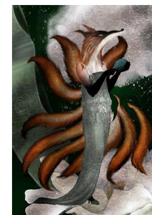
Dubravka Periša, "Kitsune", digitalni crtež, 42x29,7 cm

Izložba se može pogledati do 27. svibnja 2026.