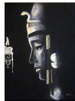
Ivana Kolić, "Izida", tempera na platnu, 50x40 cm