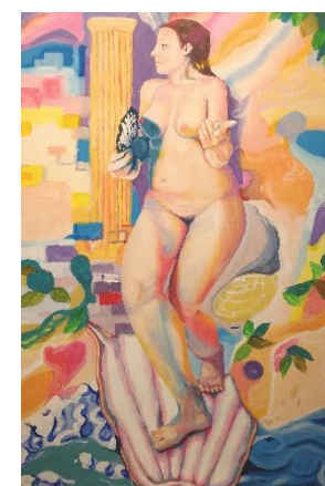
Stjepan Perković, "Afrodita", akril na platnu, 90x60 cm

Otvorenje izložbe u ponedjeljak, 27. travnja 2026. u 18,00 sati